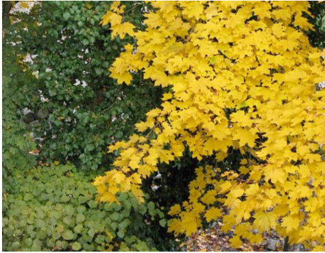
Contraste d'Automne, AM-31oct 2010