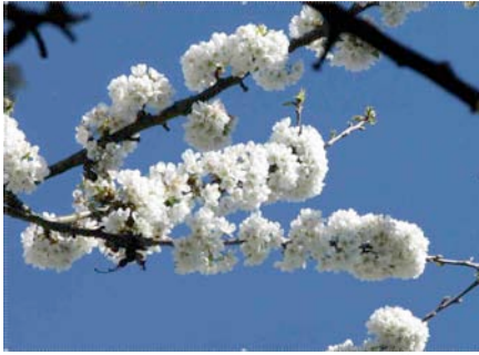
Cerisier AM, 5 avril 2011