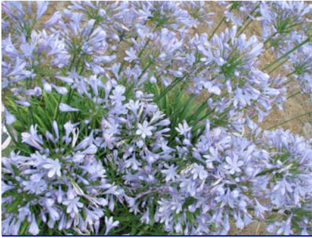
Agapanthes, AM 10 juillet 2011

La FeuilleAFEC Edition électronique d'informations de l'ASSOCIATION FRANÇAISE D'ETUDES CANADIENNES www.afec33.asso.fr/