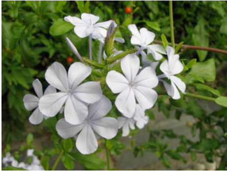
Plumbago, AM, 31 août 2011

« Si la vie n'est qu'un passage, sur ce passage au moins semons des fleurs », Michel de Montaigne