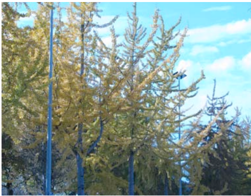
Ginkgo biloba, AM, 30 octobre 2011