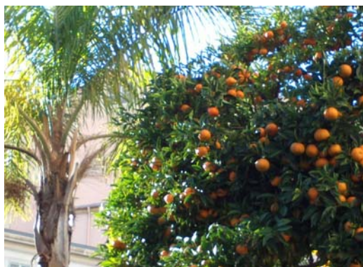
Végétation mentonnaise AM. 26 déc. 2011